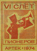
Песню дружбы поют ребята разных стран.