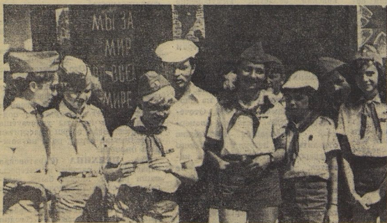
У остров пионерской отваги и мужества, в морском походе, когда артековцы отпраздновали бутылочную почту, в большом греческом жаровом ящике с ребятами был первый секретарь ЦК ВЛКСМ Е. М. Тяжелыников. Вместе со штабом слёта обсуждал он предложения делегатов, вместе решали, какими маршрутами шагать пионерам дальше по Всесоюзному маршу пионерских отрядов «Всегда готовы!».

Над стадионами прольют Государственный флаг СССР, флаги союзных республик, флаги каждой страны, приславшей в Артек своих посланцев.